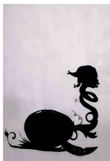
Kara Walker, Mélodie

Auteure : Nancy Lépine Inspiré de Les Chinoiseries Conseillère pédagogique en arts Commission scolaire des Trois-Lacs Septembre 2008